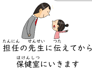
担任の先生に伝えてから 保健室にいきます