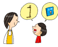
保健室のものは つかってよいか ききましょう