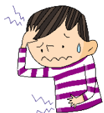
体調が わるいとき