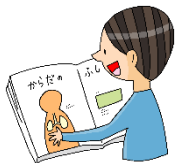
からだについて 知りたいとき