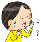
なやんでいることが あるとき