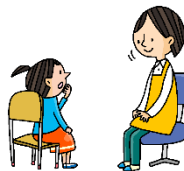
けが、体のようすを 先生にはっきり つたえましょう