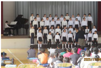
（校内での音楽発表会壮行会）