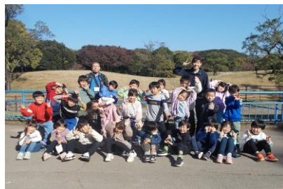
（1年 千葉市動物公園への 校外学習 2年）