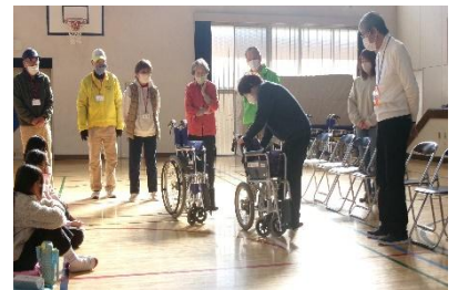
（4年 福祉学習 車いす体験）

「ふくし」とは「 ふ だんの」「 く らしを」「 し あわせに」と考えるとういようです。これからも、子どもたちが体験をとおして、よりよい学習ができるよう、ご協力をよろしくお願いいたします。