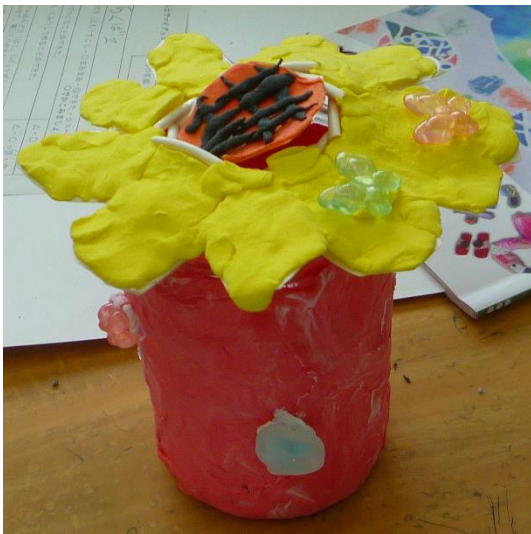
「うみからのおとどけもの」