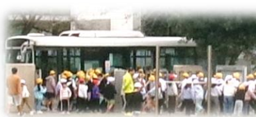
全校マラソン練習