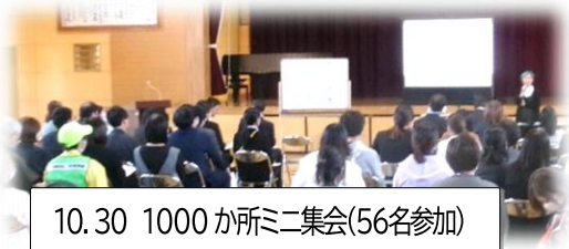
10.30 1000 か所ミニ集会(56名参加)