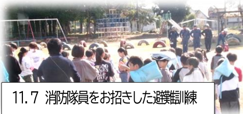
11.7 消防隊員をお招きした避難訓練