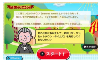
▲家庭での学習履歴が残ります