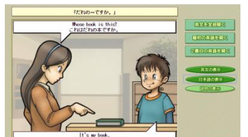
▲英文ごとに繰り返し聞けます