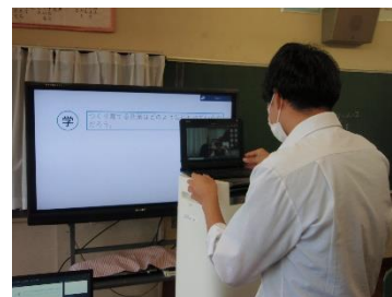
5年生社会「養殖漁業」調べ学習