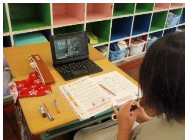
4年生音楽「ハローサミング」笛を吹いたね