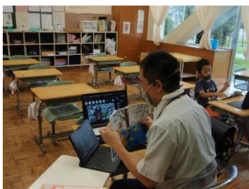
2年生国語「わにのおじいさんのたからもの」