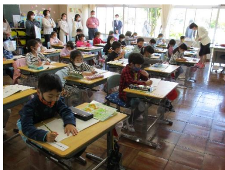
1年生初めての授業参観。 ひらがなで自分の名前を書きました

4月23日に授業参観・学級懇談会を行なわれました。1年生は入学して2週間、2～6年生は学年がひとつあがり、一段と成長した姿が見られるようになりました。昨年度より導入されましたタブレットを随時活用し授業を行っています。学級懇談会でも学級によっては保護者の方も操作したと思います。今後、タブレットはご家庭に持ち帰る機会もあります。ゴールデンウィークでは早速持ち帰り、自宅で課題に取り組むこととなります。是非、お子様と一緒に操作を確認し、親子のコミュニケーションをとるいい機会にさせていただけたらと思います。