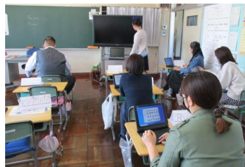
保護者の方もタブレット操作に挑戦