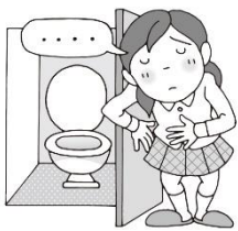
腹痛や吐き気、下痢がある

新学期は、休み明けで生活リズムがもどらなかつたり、新しい環境へ適応できずに体調が悪くなつたりする場合があります。一日を元気に過ごせる状態か朝の健康観察を必ずお願いいたします。体調が悪い場合には、無理をせずゆっくり休ませてあげてください。