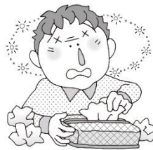
鼻水がでる、喉の痛み、咳が出るなどの風邪症状がある